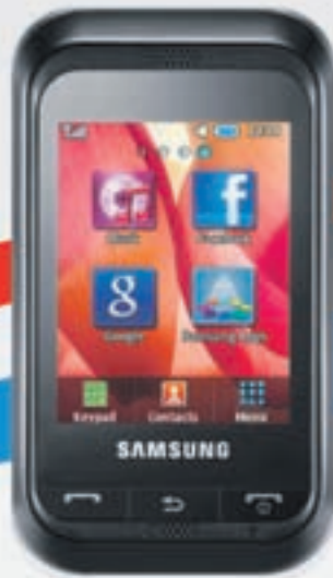
Samsung C3300 Afl 129